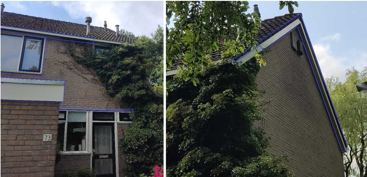
Figuur 1 Voorbeeld van de bemonstering (blauwe lijnen) door Unitura met een roller op de potentiële in- en uitvliegopeningen van een woning. Links: voorgevel; rechts: kopgevel. Adres: Thorbeckestraat 73, Zuidhorn.

Resultaten met uitkomst 'Inconclusive' (SGS) zijn opgevat als negatief (onvoldoende bewijs voor aanwezigheid van vleermuizen). Het onderzoek is blind uitgevoerd. Dit betekent dat de onderzoekers van de verschillende onderzoeksmethoden geen inzicht hebben gekregen in de onderzoeksresultaten tijdens het veldonderzoek. Hiermee is voorkomen dat de resultaten onderling zijn beïnvloed. De overeenkomsten tussen de methoden is getest met de McNemar-test voor 2x2 contingency-tabellen uit het python-pakket Statsmodels.