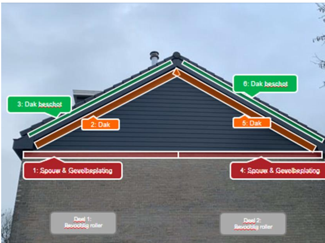
Figuur 3 Voorbeeld van monstername-plaatsen op de gevel van een grondgebonden woning.